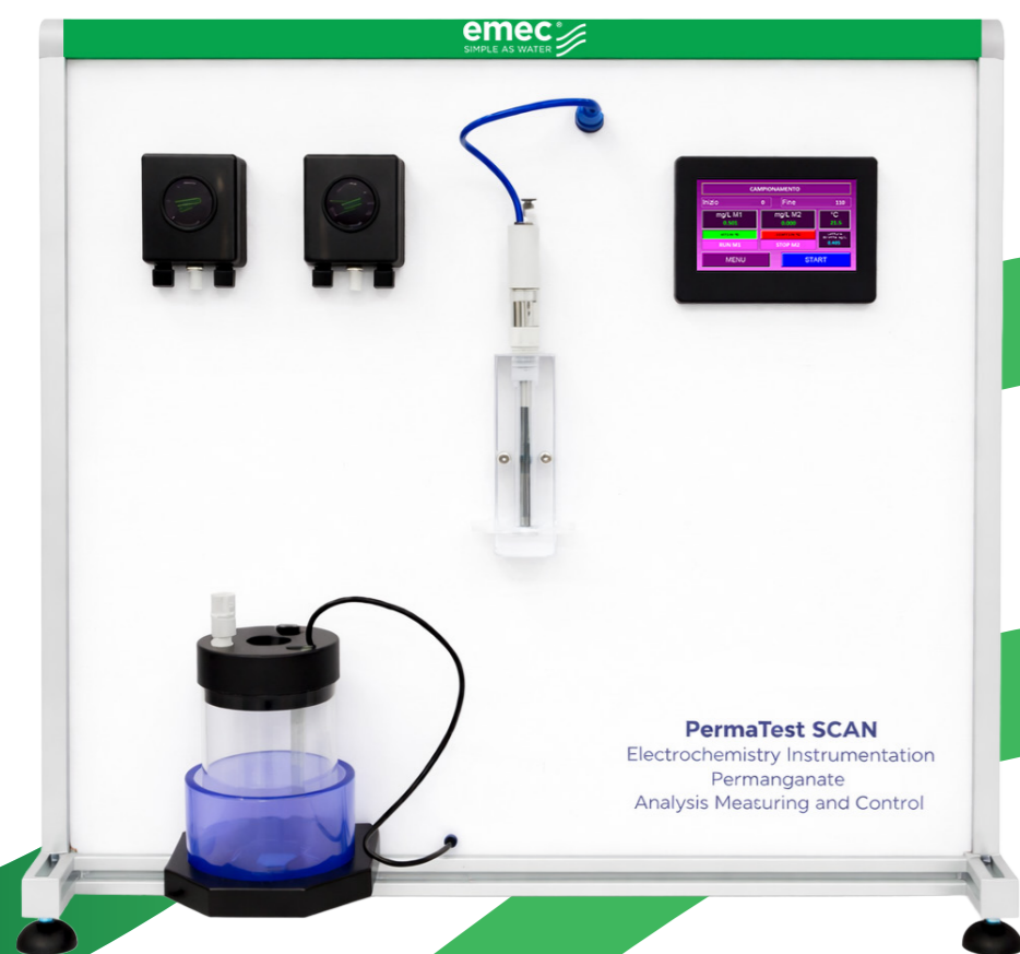
PermaTest SCAN Electrochemistry Instrumentation Permanganate Analysis Measuring and Control